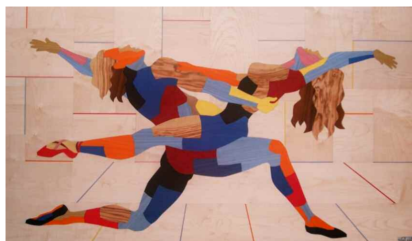
Acerodanza Il legno di acero avvolge prospetticamente la danza, trasformando i due in un UNICUM.