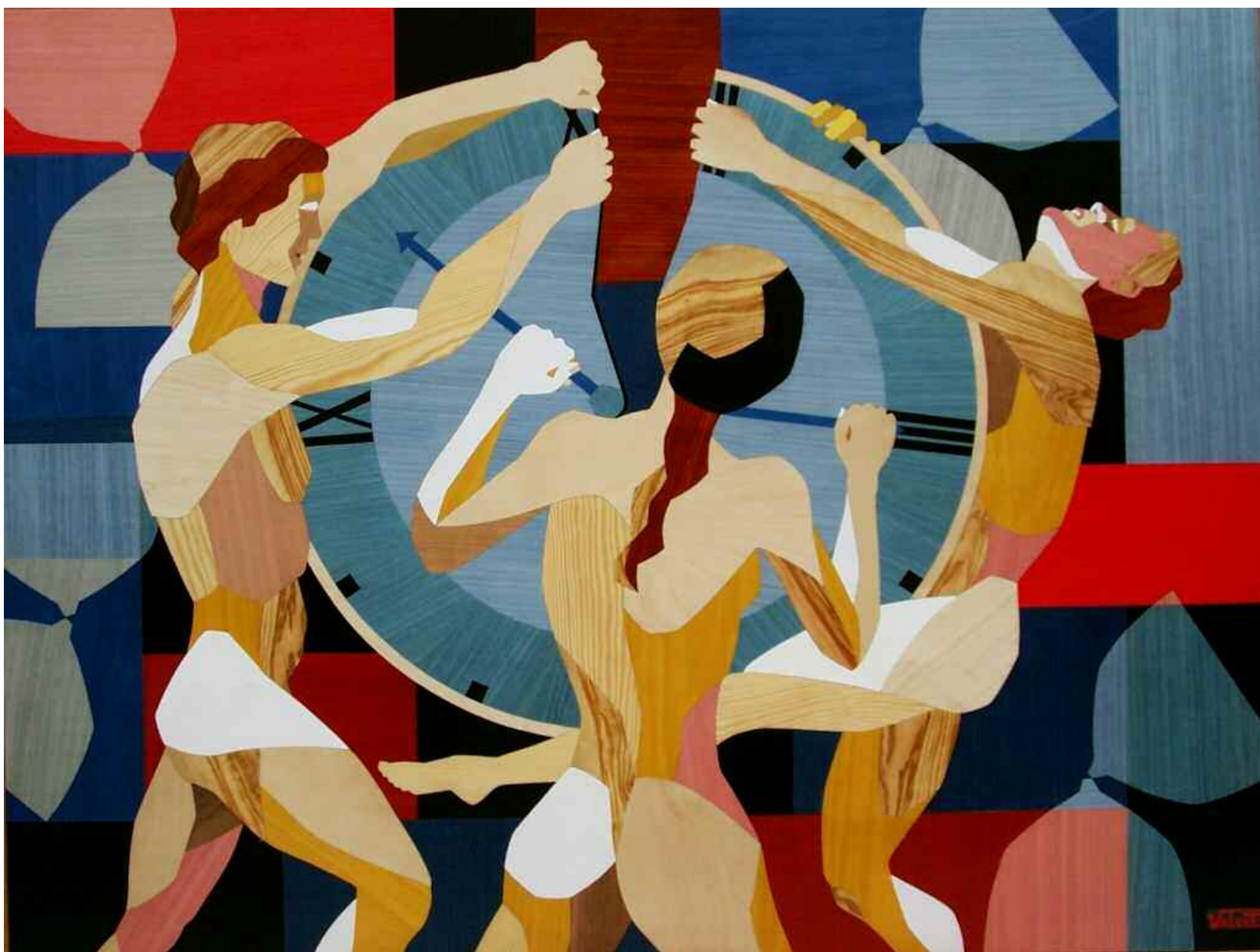
Ammazzo il tempo , tarsia in legno di Pino Valenti

Pino Valenti: «L'arte si vendica della realtà, capovolgendola, con un tentativo destinato al fallimento: non c'è tempo per "ammazzare il tempo"»