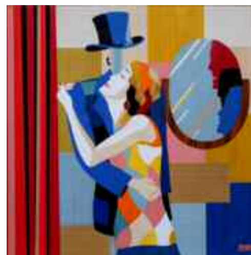
Artist - L'amore ci trasforma e ci rende capaci di realizzare l'immaginabile.