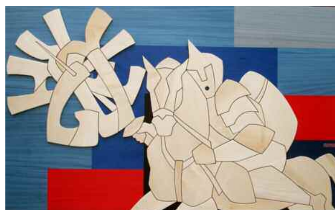
Chisciotte - La parola guerra sostituisce il mulino a vento, la pazzia romanzata diventa buon senso pacifista.