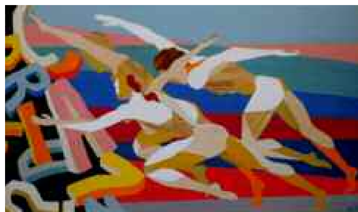
Corsa infinita - "A scuola imparerai, al lavoro imparerai, nella vita imparerai, tutto sapendo, nulla essendo..."