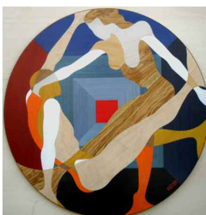
La quadratura del cerchio 3,1444444444... problema matematico irrisolto che mi richiama il rapporto uomo-donna 3,14444444...