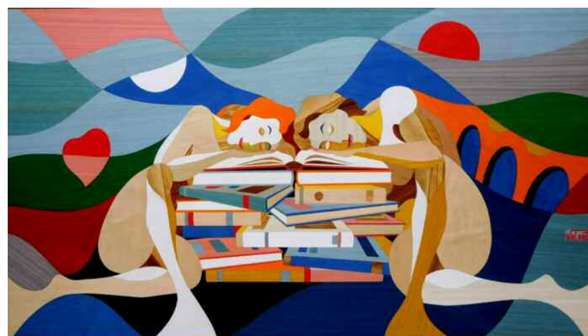
Libri sogni - Le parole scritte ci prendono per mano e ci portano a sognare, superando ostacoli e barriere diventati immateriali...