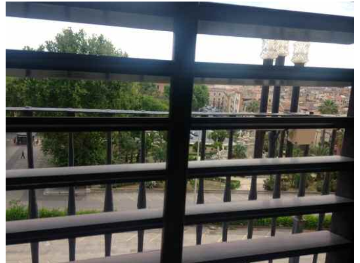
Tra le persiane del palazzo della politica a Palazzo dei Normanni (ARS)