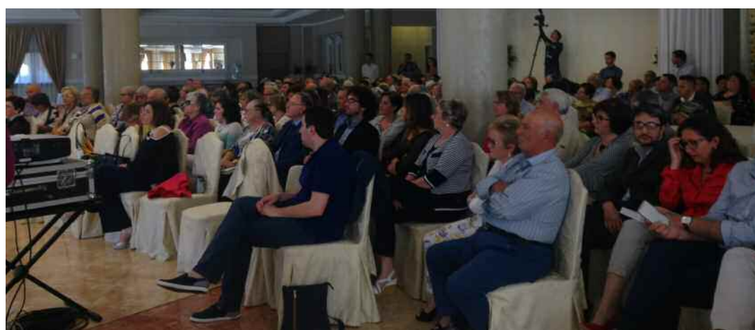
Il pubblico alla Perla di Engio