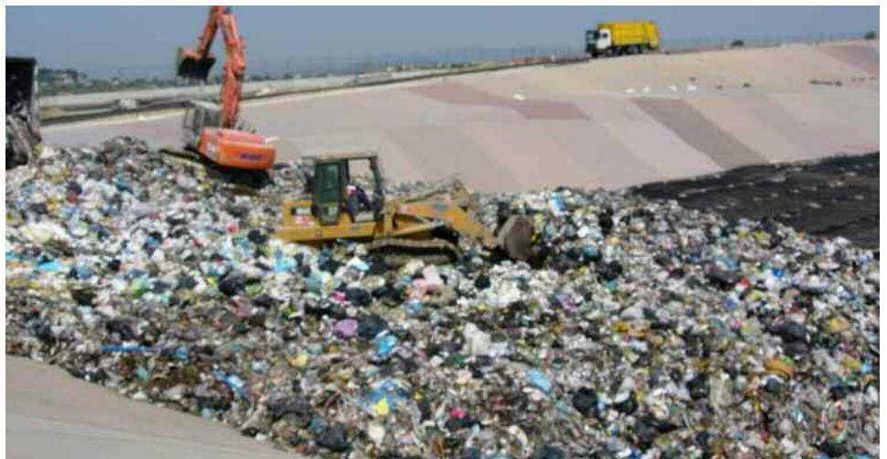
La discarica di Siculiana (AG)