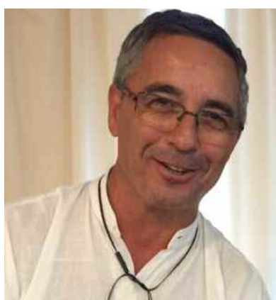
di Ignazio Maiorana

D al voto del 4 marzo quanti giorni son passati? Un governo serio è impossibile e una maggioranza parlamentare nemmeno a inventarla.