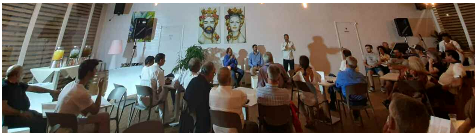
In basso, il pubblico.