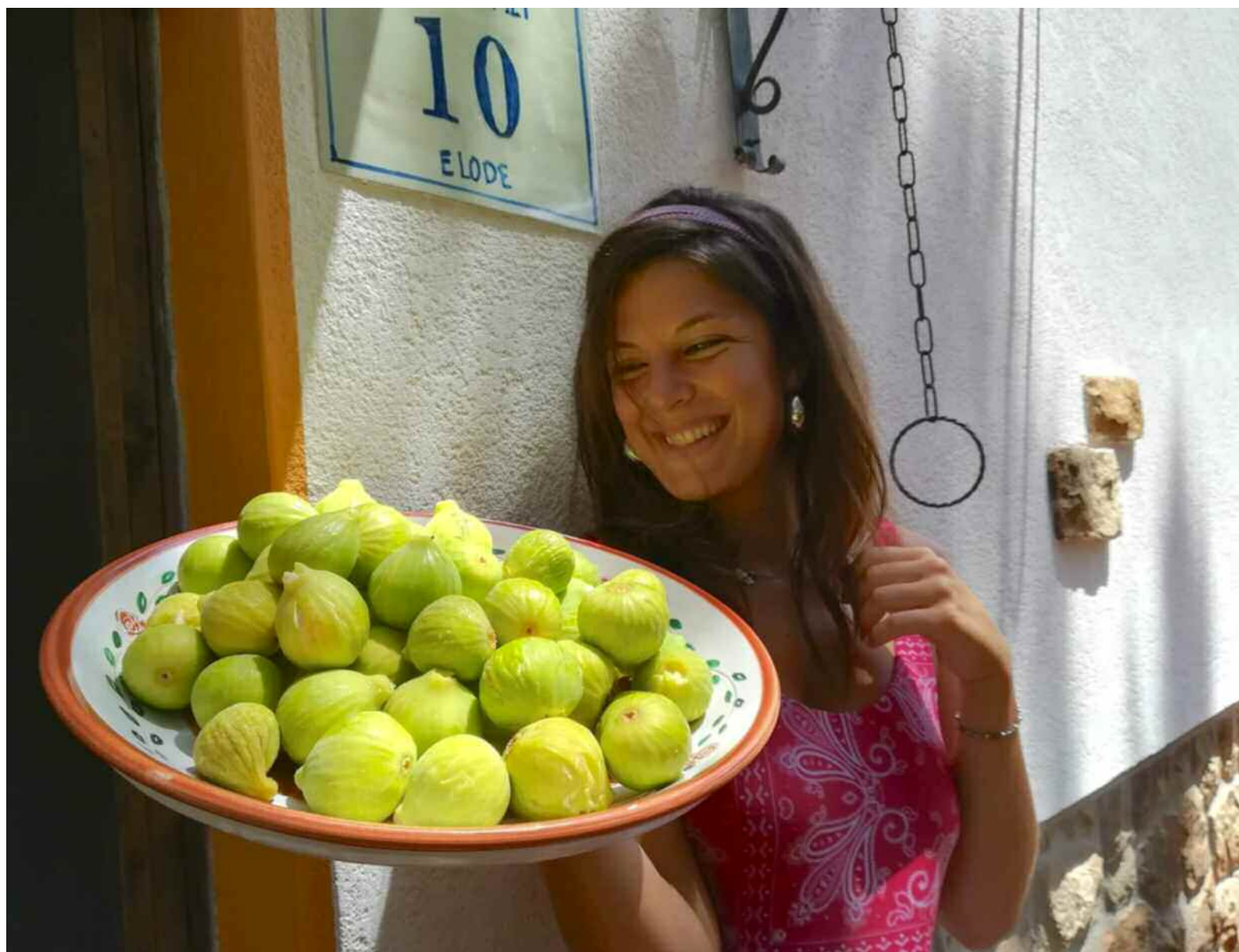
Sorriso ai fichi (foto di Alessandro Dell'Aira, di Cefalù, inserita nella mostra itinerante dell' Isola del Sorriso )